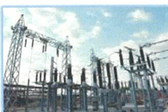
สถานีการไฟฟ้าย่อย