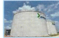
ระบบน้ำดี