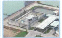
ระบบน้ำเสีย