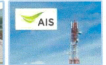
ระบบการสื่อสาร