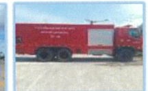
ระบบความปลอดภัย