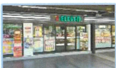
ร้านค้าสะดวกซื้อ