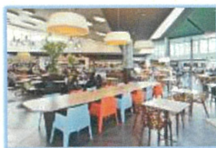
ศูนย์อาหาร