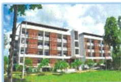
ที่พักอาศัย