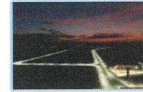
ระบบไฟฟ้า