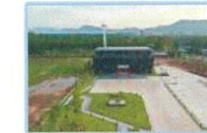
พื้นที่จอดรถ