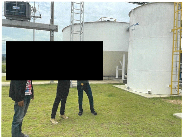
ภาพการเข้าเยี่ยมชมโครงการโดยหน่วยงานภายนอก