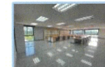
One Stop Service